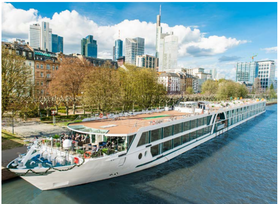
MS AMADEUS Queen

Willkommen in einer Stadt, die fast 1.300 Brücken zwischen Geschichte und Zukunft schlägt. Nach dem Frühstück servieren wir Ihnen den Zauber von Amsterdam: Kommen Sie vormittags mit auf eine beeindruckende Stadt- und Grachtenrundfahrt. Nachmittags können Sie Land- und Meeresluft schnuppern. Auf unserer Nordholland-Tour ans IJsselmeer besuchen Sie das verträumte Fischerdorf Volendam. Diese Zeitvergessenheit fern der Stadt ist ein Genuss - so wie die leckeren