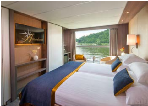
Außenkabine Strauß- und Mozartdeck

Musikkabinett« bewundern. Oder zieht es Sie eher zu einem traditionsreichen Weingut und in die Drosselgasse? Später wird es romantisch: Wir passieren den schönsten Abschnitt der Kreuzfahrt, das Obere Mittelrheintal. Wie in einem Traum ziehen 40 Burgen und der sagenumwobene Loreleyfelsen an Ihnen vorbei. Spätnachmittags erreichen wir Koblenz, wo Sie mit uns auf einem weiteren Stadtrundgang durch die gemütlichen Gassen schlendern können.