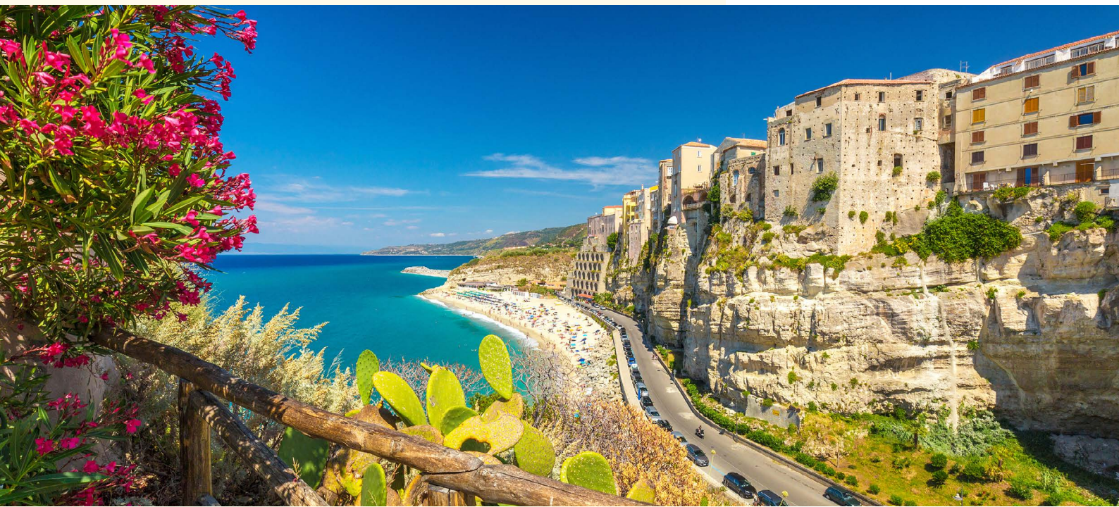
Blick auf Tropea