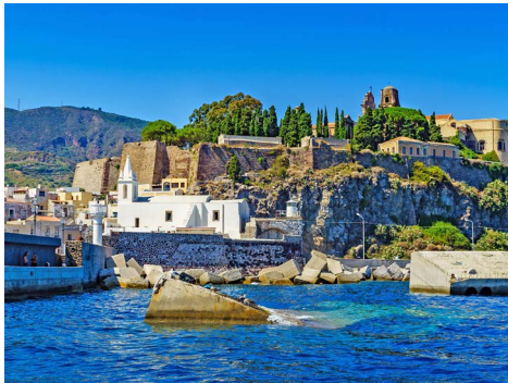
Der Hafen von Lipari