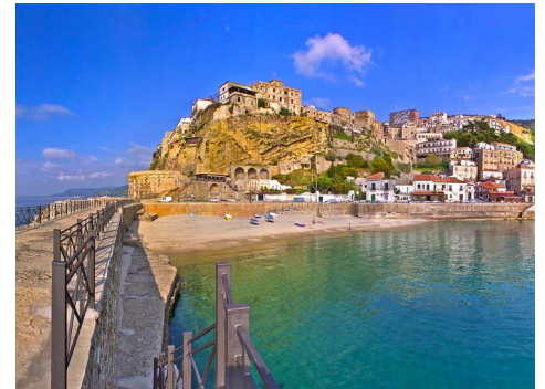
Blick auf Pizzo