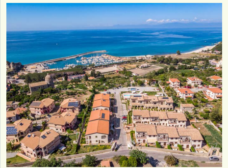
Michelizia Tropea Resort

In der Provinz Reggio Calabria liegt Scilla, eines der schönsten Dörfer Kalabriens. Auf dem Weg nach Scilla entfalten sich die Landschaftswelten der Costa Viola, die mit ihren verträumten Dörfern, der unberührten kalabrischen Natur und den felsigen Küstenlandschaften eine Panoramaaussicht auf das Tyrrhenische Meer und die Straße von Messina erlauben. Bei Scilla angekommen, gilt der erste Besuch Chianalea, dem in Scilla integrierten alten Fischerdorf, der Klippe von Scilla mit dem historischen Castello Ruffo di Scilla und der traditionsreichen Kirche Chiesa