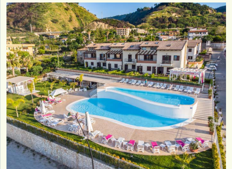
Pool des Resorts