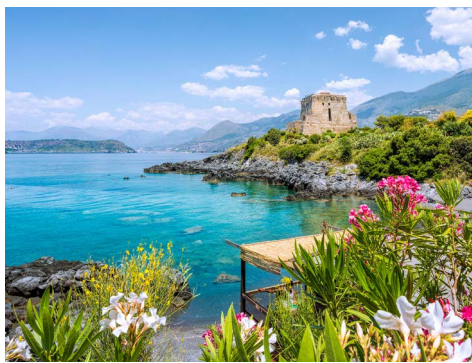
Die Küste Kalabriens