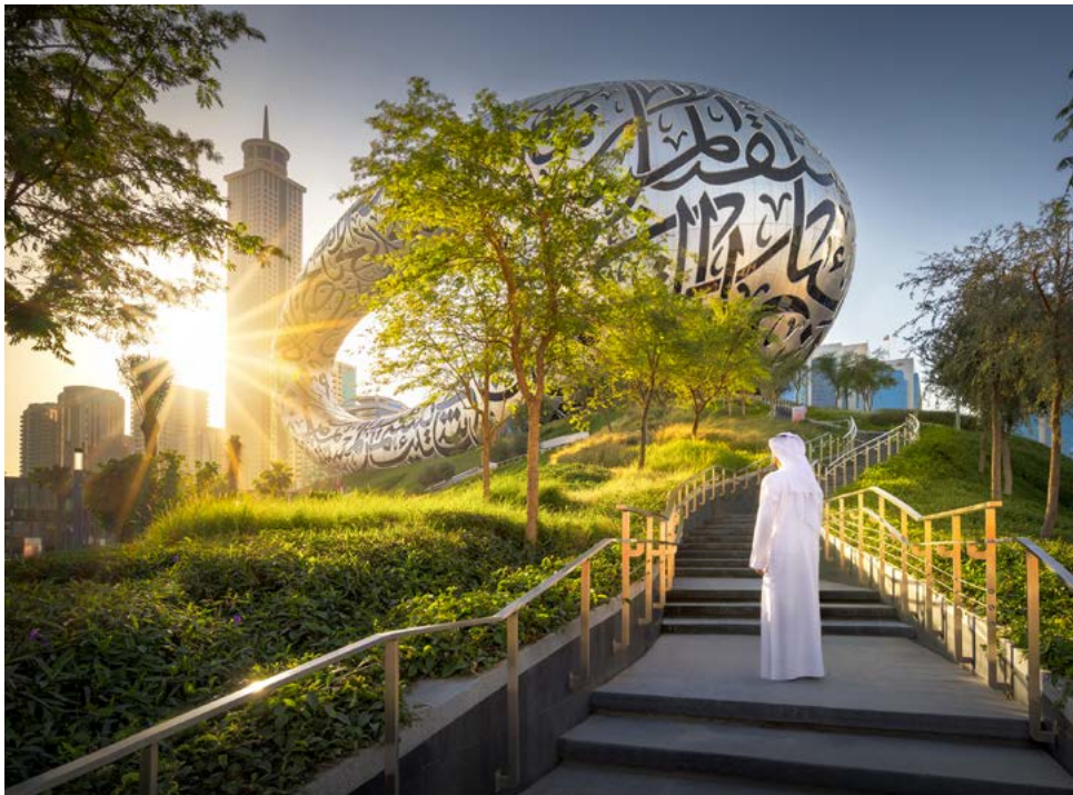
Einzigartig: die Architektur des Museum of the Future