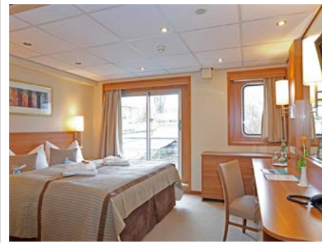
Suite auf dem Diamant-Deck

Caspar David Friedrich. Lebenslinien: Das Pommersche Landesmuseum verfügt mit sechs Gemälden, mehr als 60 Zeichnungen und Druckgrafiken sowie zahlreichen Archivalien und Briefen über eine der umfangreichsten Sammlungen an Originalmaterialien aus Caspar David Friedrichs Leben und Werk weltweit. Die Sonderausstellung »Lebenslinien« präsentiert die umfangreichen Bestände des Museums erstmals nahezu geschlossen und bringt sie in einen Dialog mit Kostbarkeiten wie dem Taufeintrag von 1774 und zusätzlich geliehenen Arbeiten als besonderen »Geburtstagsgästen«, um so den Weg Friedrichs von den ersten zeichnerischen Gehversuchen bis zum malerischen Spätwerk nachzuzeichnen. Schirmfrau der Sonderausstellung ist Staatsministerin für Kultur und Medien Claudia Roth.