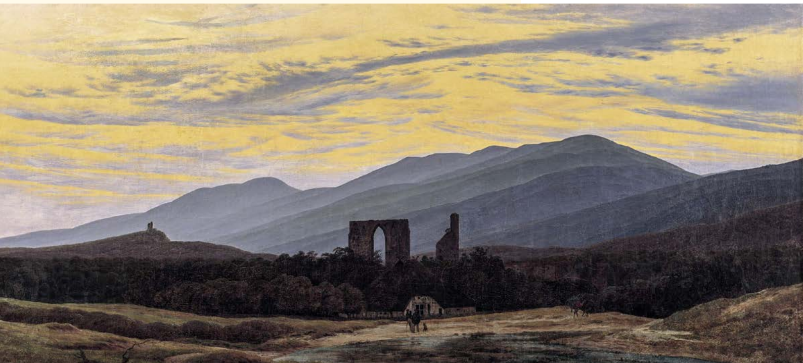
Caspar David Friedrich: Ruine Eldena im Riesengebirge