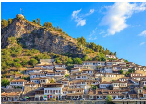
Stadt der 1000 Fenster: Berat