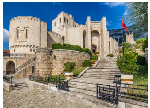
Die Festung von Kruje