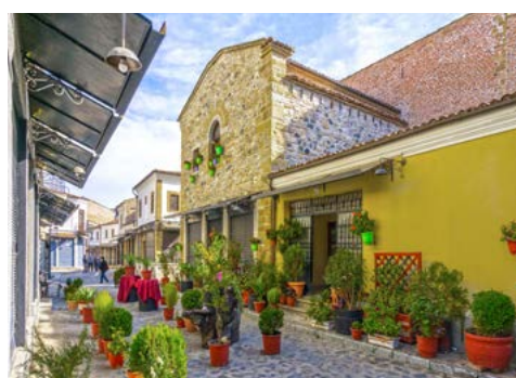
Bazarstraße in Korça

Am Morgen brechen Sie auf nach Butrint, ebenfalls UNESCO-Weltkulturerbe. Die Ausgrabungen hier enthüllen eine Fülle antiker Gebäude, von denen erstaunlich gut erhaltene Teile zu bewundern sind. Ein Höhepunkt ist das farbenprächtige Mosaik im Baptisterium, das zwei Pfauen und eine Vase mit Weintrauben zeigt. Die beeindruckende Historie dieser Stätte wird lebendig. Auf dem Rückweg nach Sa-