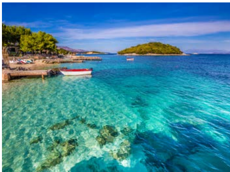
Die Küste bei Ksamil