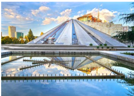
Pyramide von Tirana

beeindruckende Stadt am Meer, umgeben von Bergen, verspricht eine entspannte Atmosphäre und die Möglichkeit, die Eindrücke des Tages zu reflektieren. Abendessen und Übernachtung.