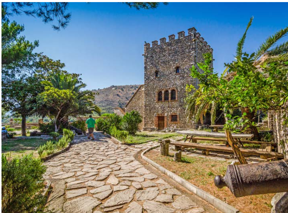
Venezianischer Turm in Butrint