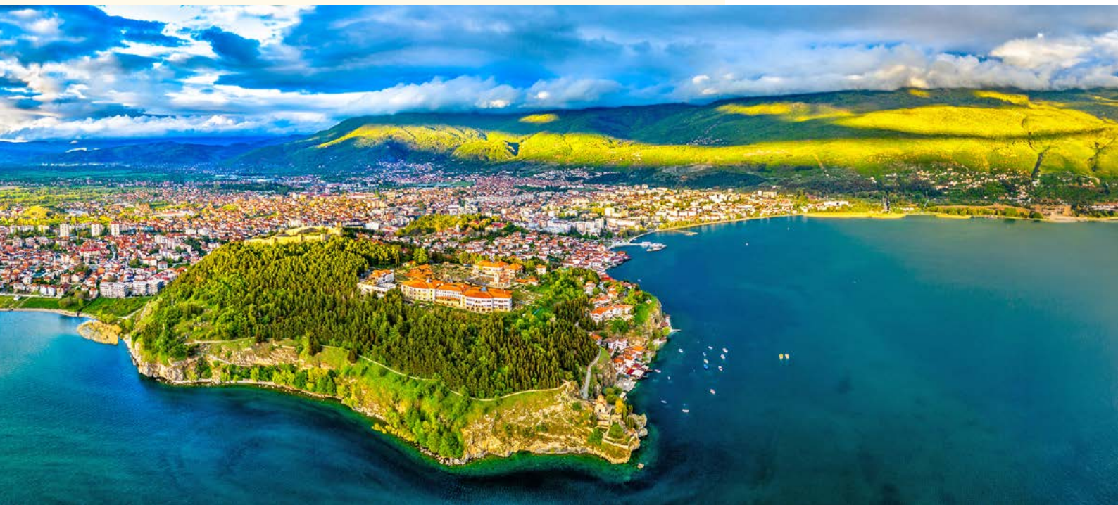
Blick auf Ohrid