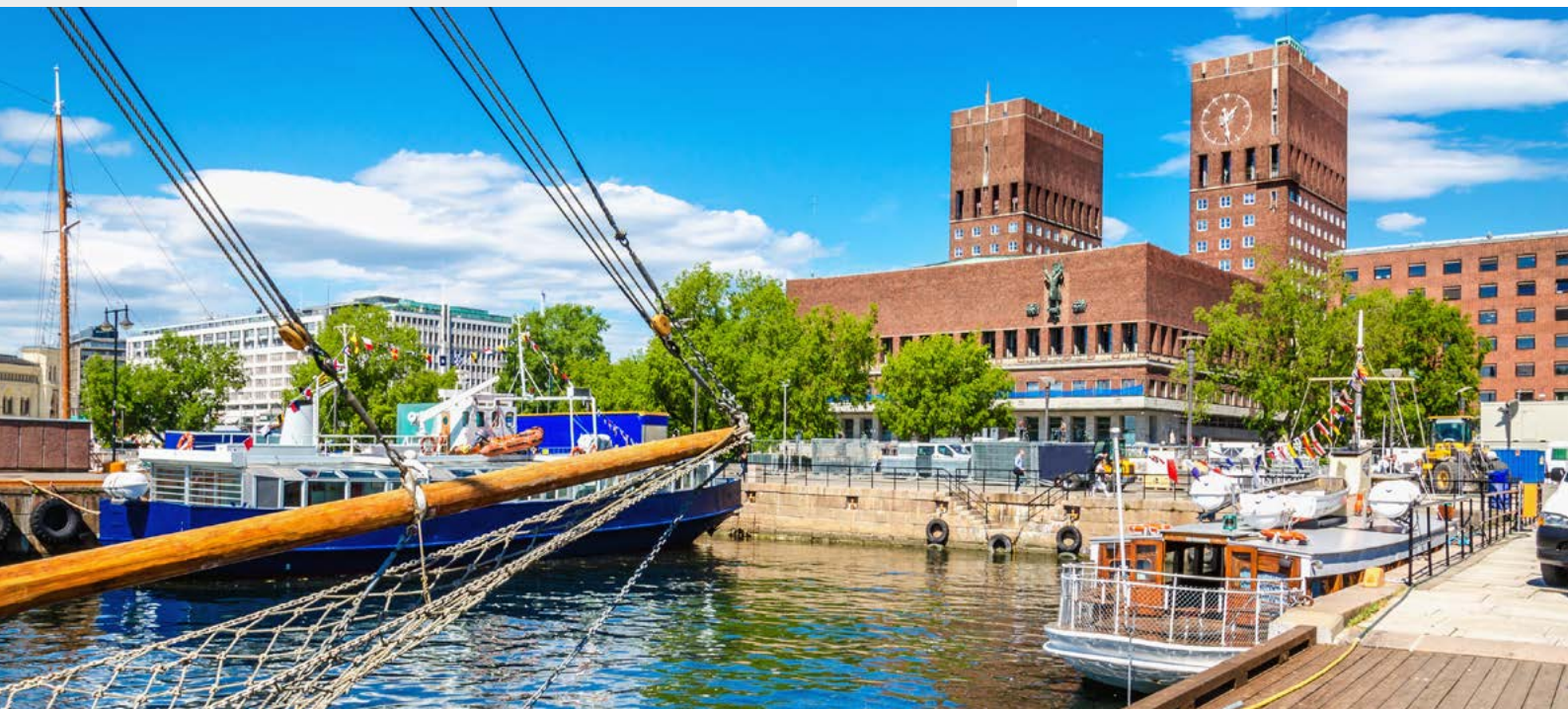
Rathaus in Oslo