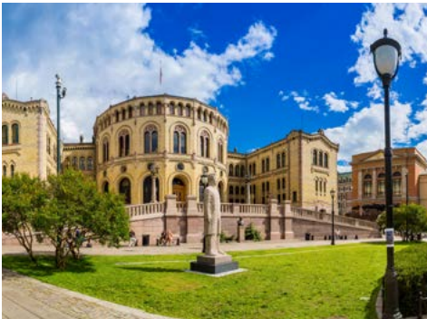
Parlament in Oslo