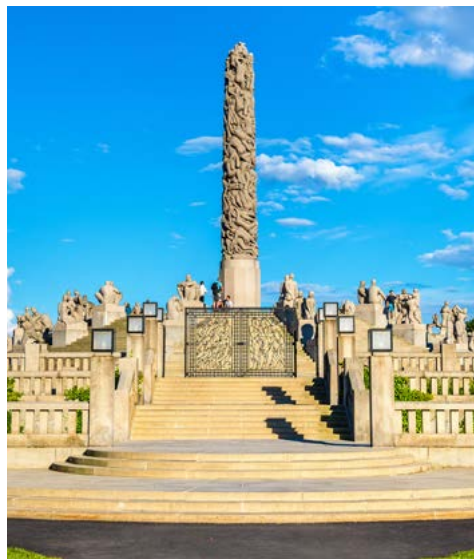
Frogner Park - Oslo

Der heutige Tag gehört nahezu komplett dem großartigen am 11.6.2022 eröffnetem Nationalmuseum Oslos. Eigentlich beherbergt es fünf Museen unter einem Dach. Stellen Sie sich Ihren ganz individuellen Museumsrundgang zusammen, oder aber entdecken Sie die vielen Höhepunkte der umfangreichen Sammlungen zusammen mit Ihrem Globalis-Reiseleiter. Er kennt das Haus bereits bestens und steht Ihnen mit vielen Tipps und Anregungen zur Seite. Auch im Nationalmuseum finden Sie viele Werke des norwe-