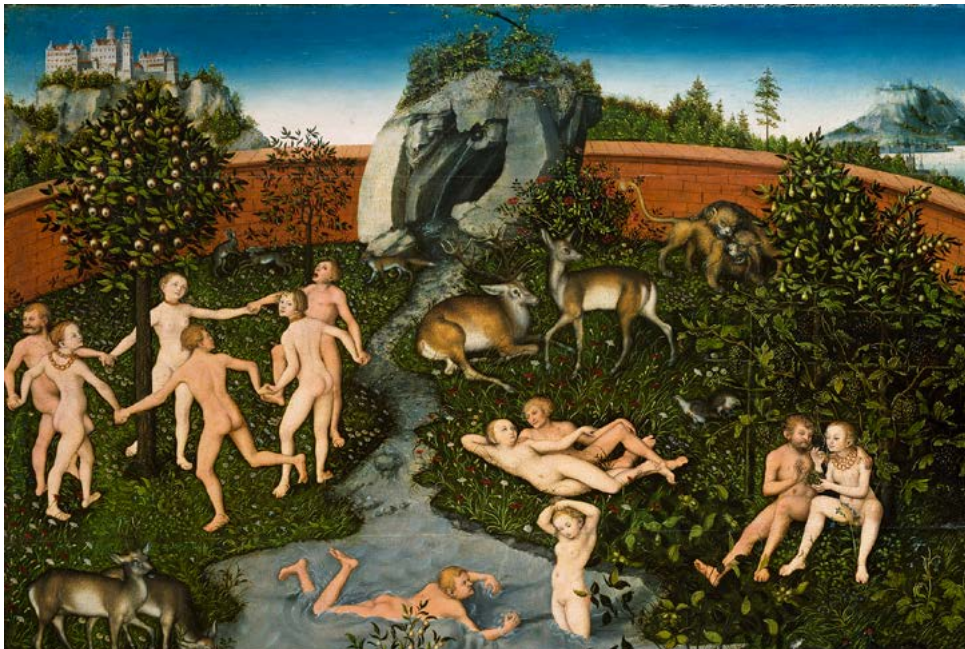
Lucas Cranach der Ältere: Das Goldene Zeitalter