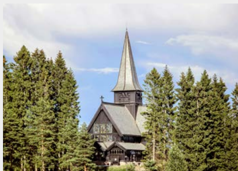
Kapelle auf dem Holmenkollen