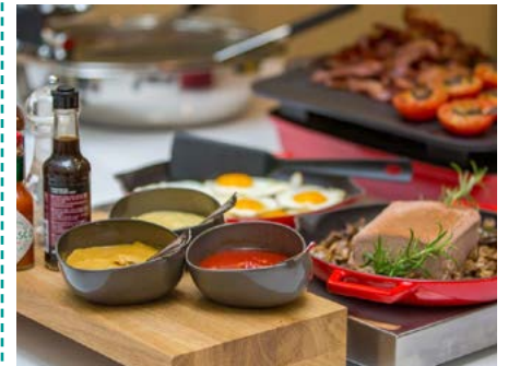
Umfangreiches Frühstück im Hotel