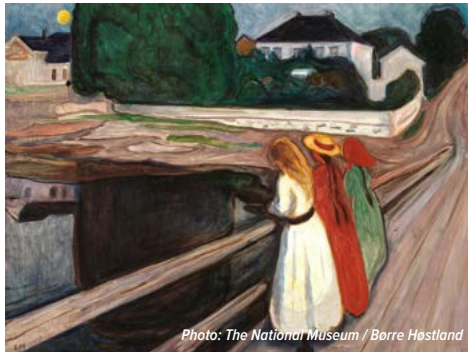
Edvard Munch: Mädchen auf der Brücke