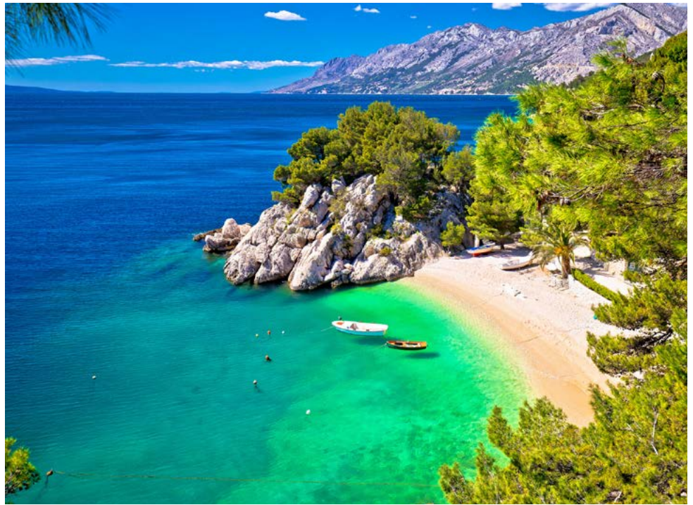
Makarska-Riviera mit dem mächtigen Biokovo-Gebirge

Mit Dubrovnik steuert die Kreuzfahrt-Yacht heute die „Perle der Adria“ an. Nach kurzer Fahrt und einem ausgiebigen Badestopp genießen Sie beim Mittagessen einen herrlichen Panoramablick auf die zerklüftete Küste und bewundern die UNESCO-Welterbestadt vom Wasser aus. Einst als Republik Ragusa gegründet war Dubrovnik jahrhundertlang eine unabhängige Stadtrepublik, die durch florierenden Handel zu Wohlstand gelangte, der sich noch heute im Stadtbild zeigt. Nach kurzem Transfer vom Hafen Gruž in die autofreie Altstadt führt ein Stadtspaziergang zu den beeindruckenden Zeugnissen verschiedener Kulturen und Epochen innerhalb der zwei Kilometer langen Stadtmauer. Über den Stradun, die älteste Straße Dubrovniks, flanieren bereits berühmte Persönlichkeiten, sehenswert