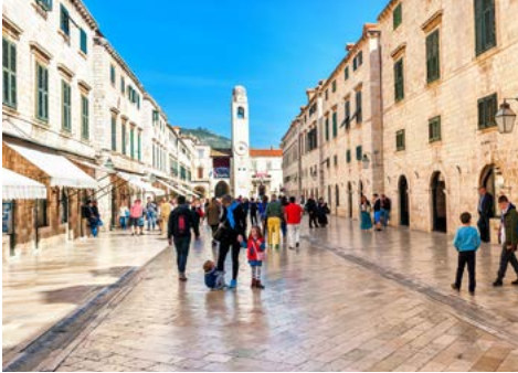
Stradun, Dubrovnik

ckende Küstenlandschaft der Makarska-Riviera mit dem mächtigen Biokovo-Gebirge. Bei einem zweistündigen Badestopp in einer der zahlreichen Buchten besteht die Gelegenheit, in das kristallklare Wasser Dalmatiens einzutauchen. Zum Mittagessen begibt sich die Motoryacht auf die zweite Etappe des Tages und erreicht am späten Nachmittag den Ort Trstениk auf der Südseite von Pelješac. Nach einer Weinprobe an Bord haben Sie die Möglichkeit, im Ort in eine urige Konoba einzukehren und dort traditionell kroatische Spezialitäten in familiärer Atmosphäre zu genießen. Serviert werden würzige Fleisch- und Fischspeisen, die nach alter Tradition unter einer „Peka“, einer kuppelförmigen Backglocke, in einer offenen Feuerstelle gegart werden. Dieses typische Abendessen ist im Reisepreis nicht enthalten und kann an Bord gebucht werden.