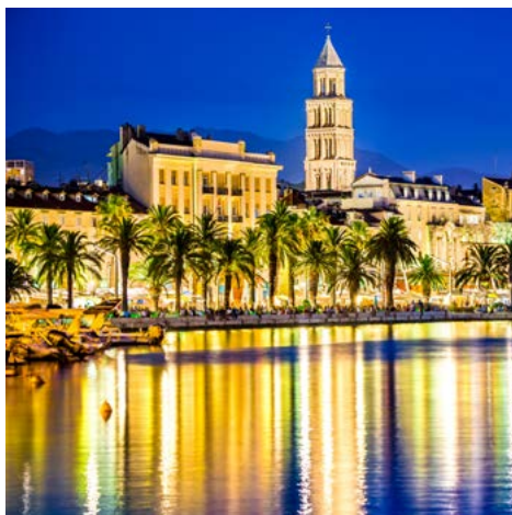
Uferpromenade in Split

Welt und ist bei Badegästen und Kitesurfern gleichermaßen beliebt. Am Vormittag legt die San Antonio im Ort Bol an, von dort ist das beliebte Ausflugsziel zu Fuß oder mit einer kleinen Bahn rasch erreicht. Nach dem Mittagessen an Bord gibt es einen letzten Badestopp, bevor das Schiff in den historischen Hafen von Split einläuft. Die zweitgrößte Stadt Kroatiens begeistert mit dem mächtigen Palast des Kaisers Diokletian, der bereits im 4. Jahrhundert im Stil römischer Kastelle angelegt wurde und heute in gut erhaltener Form einen Großteil der Altstadt umfasst. Ein begleiteter Stadtspaziergang führt durch das Gassengewirr des UNESCO-Welterbes zu Sehenswürdigkeiten wie dem Peristyl oder der Kathedrale des Heiligen Domnius mit Schatzkammer. Den letzten Abend der Reise können Sie mit einem Sundowner an der palmengesäumten Uferpromenade Riva beschließen. Übernachtung an Bord.