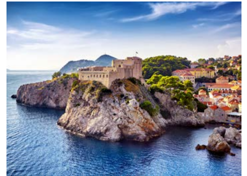
Festung Lovrijenac

Juni bis Oktober 2022 • 8 Tage ab/an Split • ab € 1.395,- p.P. in der 2-Bett-Kabine