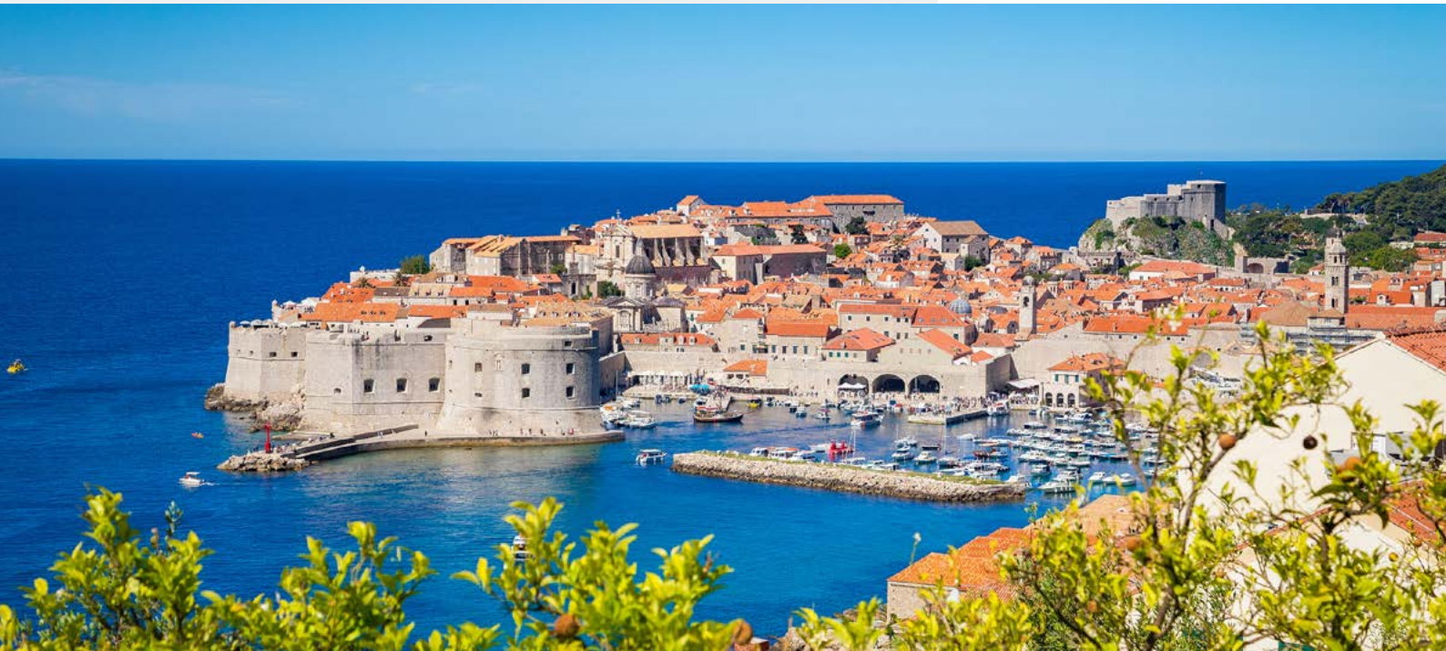
Die Altstadt von Dubrovnik