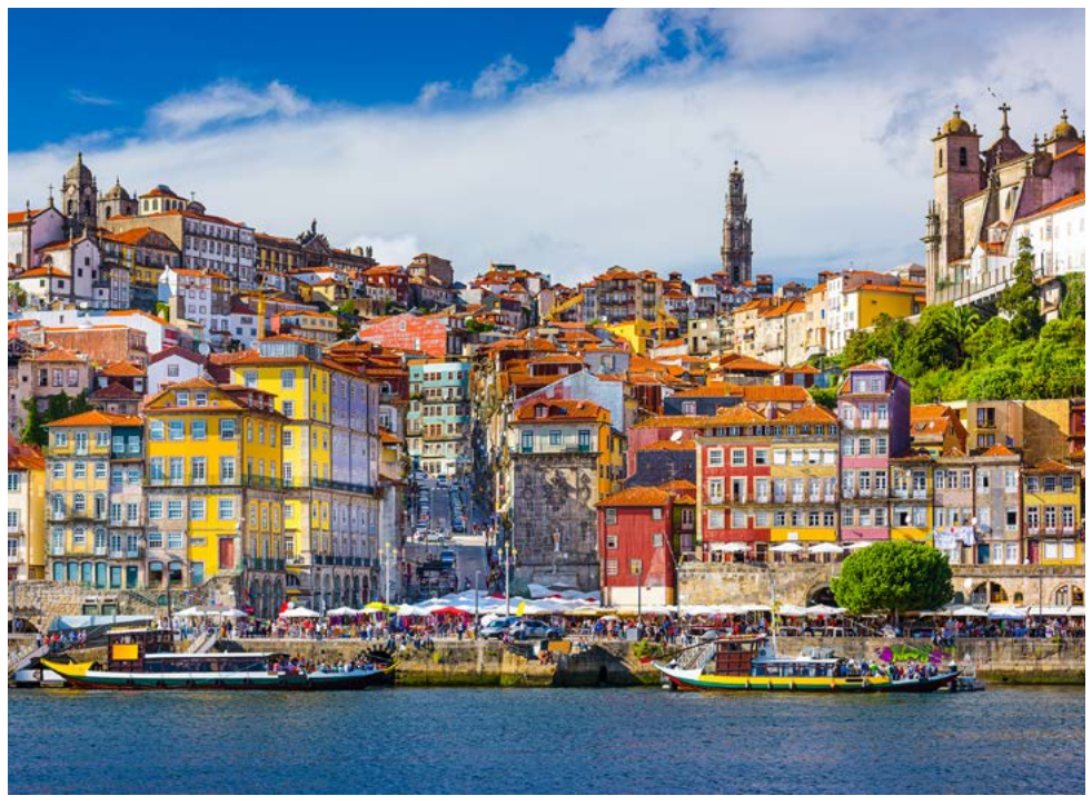
Die Altstadt von Porto

*) Änderung der Landausflüge vorbehalten. Alle Zeiten sind als Richtzeiten zu betrachten.