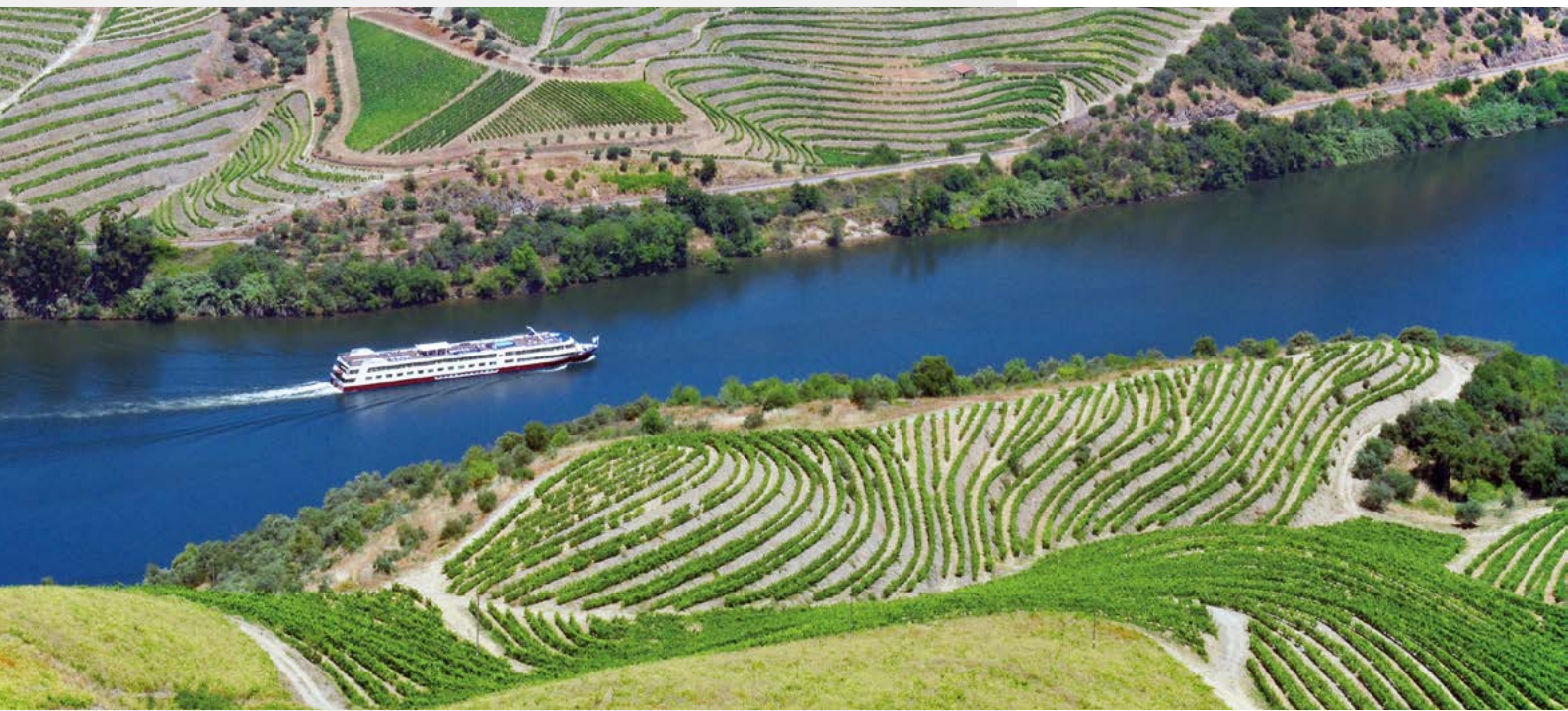
MS Douro Cruiser