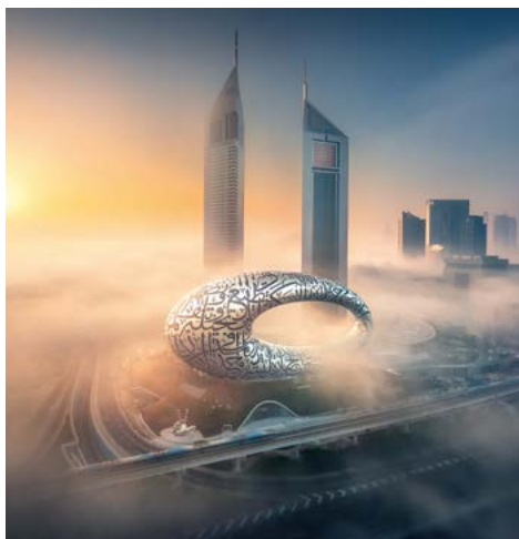
Museum Of The Future