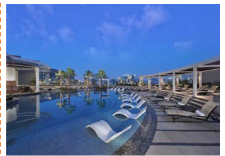
Pool mit Sonnenterrasse im Hyatt Regency

Der letzte Tag in den Emiraten steht zu Ihrer freien Verfügung. Unser Tipp für Ihre individuelle Tagesgestaltung ist das »Museum of the Future«. Hier zeigen Ihnen die Verantwortlichen der Emirate ihre Vorstellungen von Teilbereichen unseres Lebens in der Zukunft. Die Ambitionen der VAE im Bereich der Raumfahrt sind bekannt und hier zeigt Ihnen das Land seine Ideen in diesem Bereich. Wir haben für Sie Eintrittskarten für das begehrte Museum reserviert.