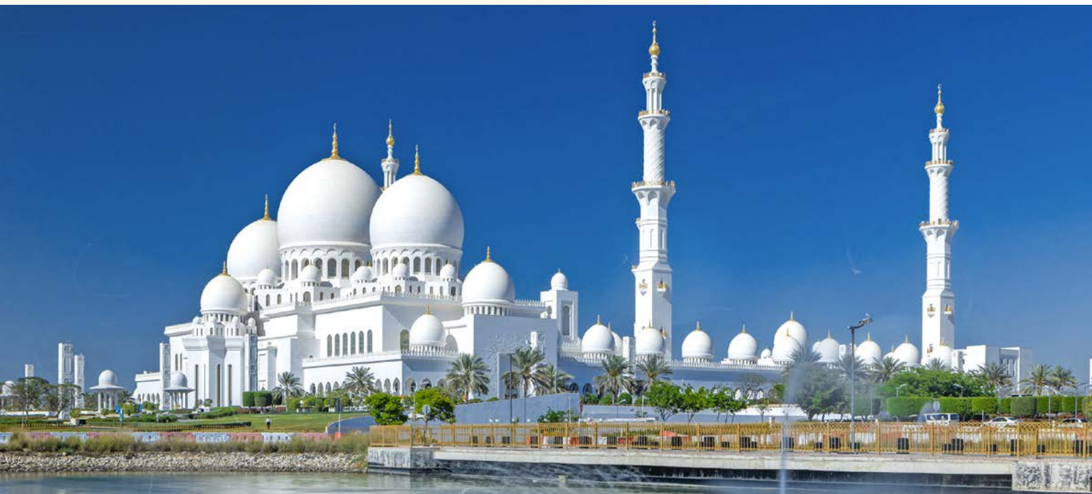
Sheikh-Zayed-Moschee in Abu Dhabi