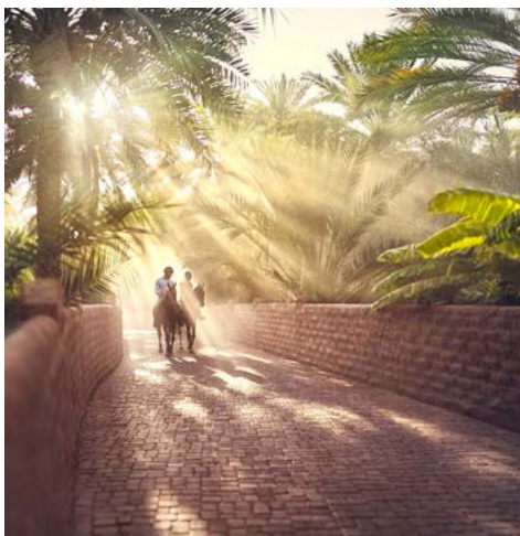
In Al Ain