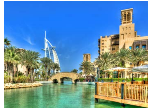
Burj al Arab