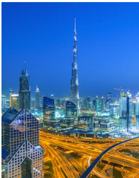
Skyline von Dubai

Fliegen mit Emirates bedeutet mehr Komfort, leckeres Essen und preisgekrönte Unterhaltung an Bord. Emirates Airlines ist eine der führenden Fluggesellschaften der Welt. Mit ihrer modernen Flotte an Langstreckenjets verbindet die Airline Dubai mit nahezu der ganzen Welt. In allen Klassen verfügen die Emirates-Flugzeuge über eine ausgezeichnete Ausstattung mit komfortablen Flugsitzen und einem exzellenten Bordservice. Das In-Seat-Entertainment sucht seinesgleichen und lässt die Zeit im wahrsten Sinne des Wortes wie im Fluge vergehen. Freuen Sie sich bereits bei der Anreise auf die emiratische Gastfreundschaft und einen erlebnisreichen Flug an Bord der Emirates-Flotte!