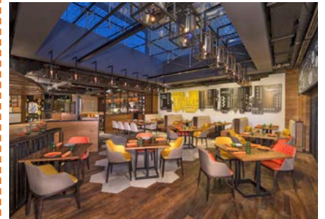
Restaurant im Hyatt Regency