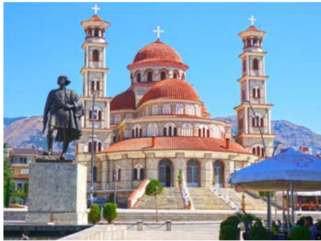
Orthodoxe Kathedrale in Korca