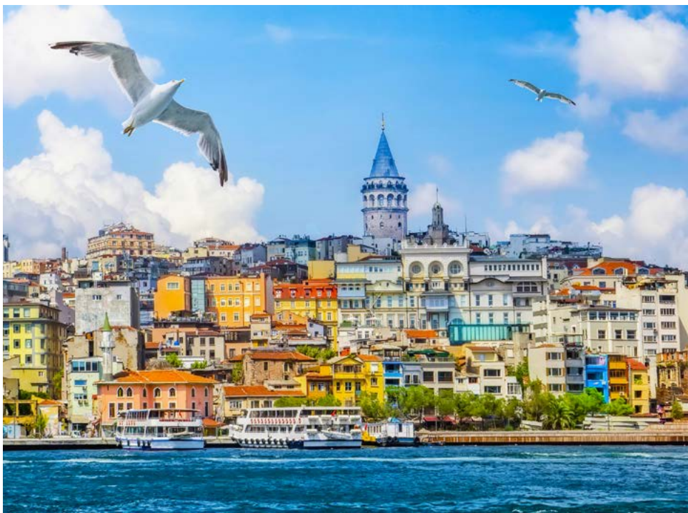
Der Galataturm am Goldenen Horn