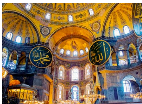
In der Hagia Sophia

Ein Höhepunkt jagt den nächsten. Zu Fuß geht es weiter zur Sultan-Ahmed-Moschee, auch bekannt als die Blaue Moschee. Sie ist ein Hauptwerk der osmanischen Architektur und prägt die Silhouette der Stadt seit über 400 Jahren. Der Prachtbau mit sechs Minaretten verdankt seine Berühmtheit in Europa dem Reichtum an blau-weißen Fliesen, die die Kuppel und den oberen Teil der Mauern