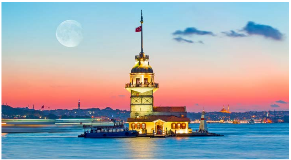
Der Leanderturm im Bosphorus