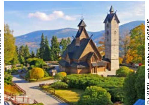
Stabkirche in Krummhübel

Frühjahr, Sommer und Herbst 2024 • 8 Tage • € 1.495,- p.P. im DZ