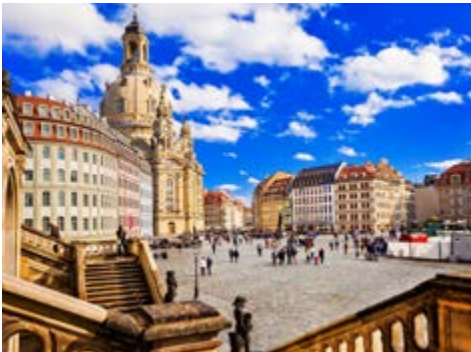
Der Neumarkt in Dresden