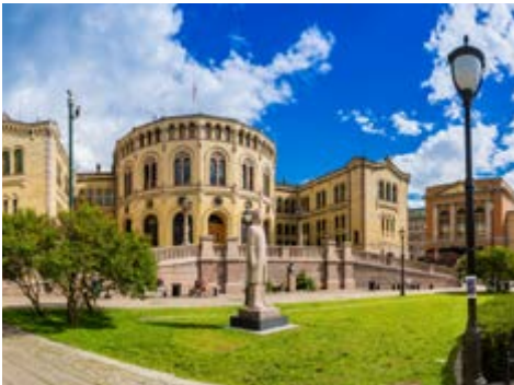
Parlament in Oslo