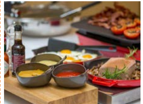
Umfangreiches Frühstück im Hotel