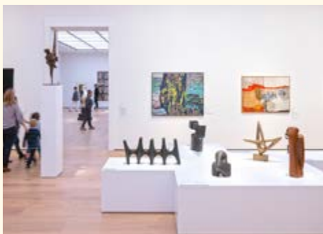
Im Nationalmuseum Oslo