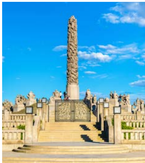
Frogner Park - Oslo

Der heutige Tag gehört nahezu komplett dem großartigen am 11.6.2022 eröffnetem Nationalmuseum Oslos. Eigentlich beherbergt es fünf Museen unter einem Dach. Stellen Sie sich Ihren ganz individuellen Museumsrundgang zusammen, oder aber entdecken Sie die vielen Höhepunkte der umfangreichen Sammlungen zusammen mit Ihrem Globalis-Reiseleiter. Er kennt das Haus bereits bestens und steht Ihnen mit vielen Tipps und Anregungen zur Seite. Auch im Nationalmuseum finden Sie viele Werke des norwegischen Malers von Weltruf Edvard Munch, u.a. das bereits erwähnte erste Gemälde mit dem Titel „Der Schrei“. Um 15:30 Uhr unternehmen wir dann eine Bootstour durch die Fjordwelt Oslos und genießen das sich uns bietende Panorama und die malerische Fjordwelt. Die Tour endet gegen 18:00 Uhr wieder in