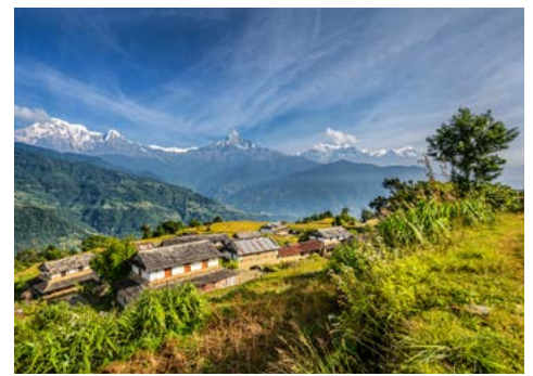
Bergdorf bei Pokhara