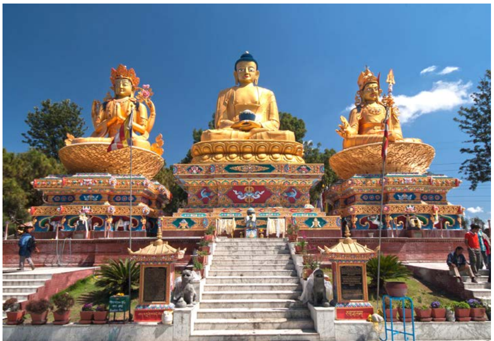
Wunderschöne Figuren in Kathmandu