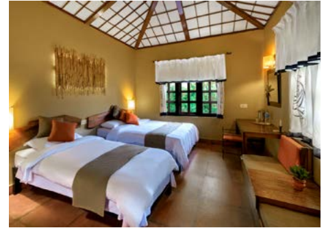
Green Mansions Jungle Lodge