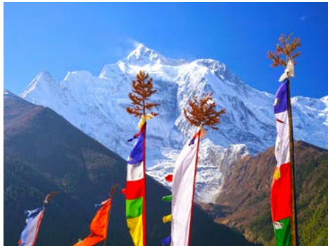
Blick auf die Annapurna