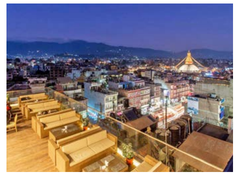
Dachterrasse des Hotels Tibet International

Vor dem Frühstück sind Sie eingeladen, einer Pooja-Zeremonie (ca. 1 h) im Kloster beizuwohnen. Nach dem gemeinsamen Frühstück mit Mönchen, lernen Sie den Alltag der Mönche im Kloster kennen und besichtigen den Tempel, den Hauptschrein mit seinen Mandalas, die Gebetsräume, Unterrichtsäume, sowie die Küchen des Klosters. Danach fahren Sie in das malerische Pokhara-Tal. Nirgendwo sonst steigt der Himalaya so drastisch von 1000 m auf 8000 m an! In Pokhara treffen Sie eine nepalesische Familie, kaufen gemeinsam auf dem Wochenmarkt ein, kochen gemeinsam lokale Spezialitäten und essen gemeinsam zu Mittag. Abendessen und Übernachtung im Hotel Bar Peepal.