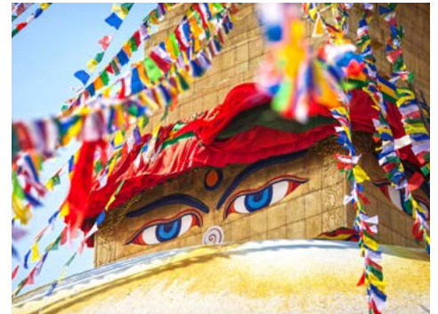
Die Augen des Buddhas