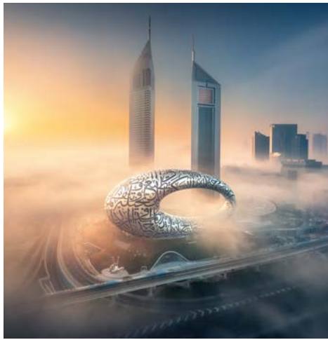
Museum Of The Future