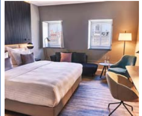
Zimmerbeispiel Hotel de Saxe