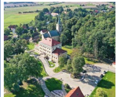
In schöner Lage: Schlosshotel Hohenliebenthal