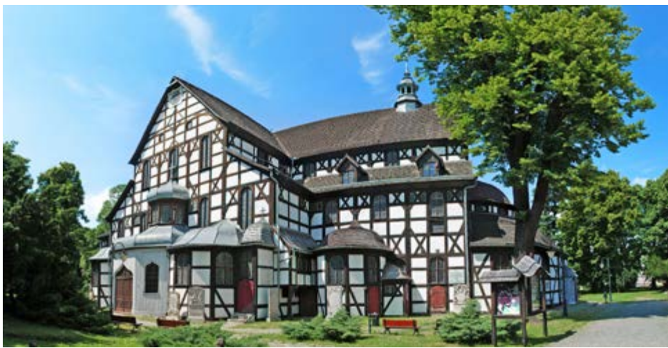
Friedenskirche in Schweidnitz