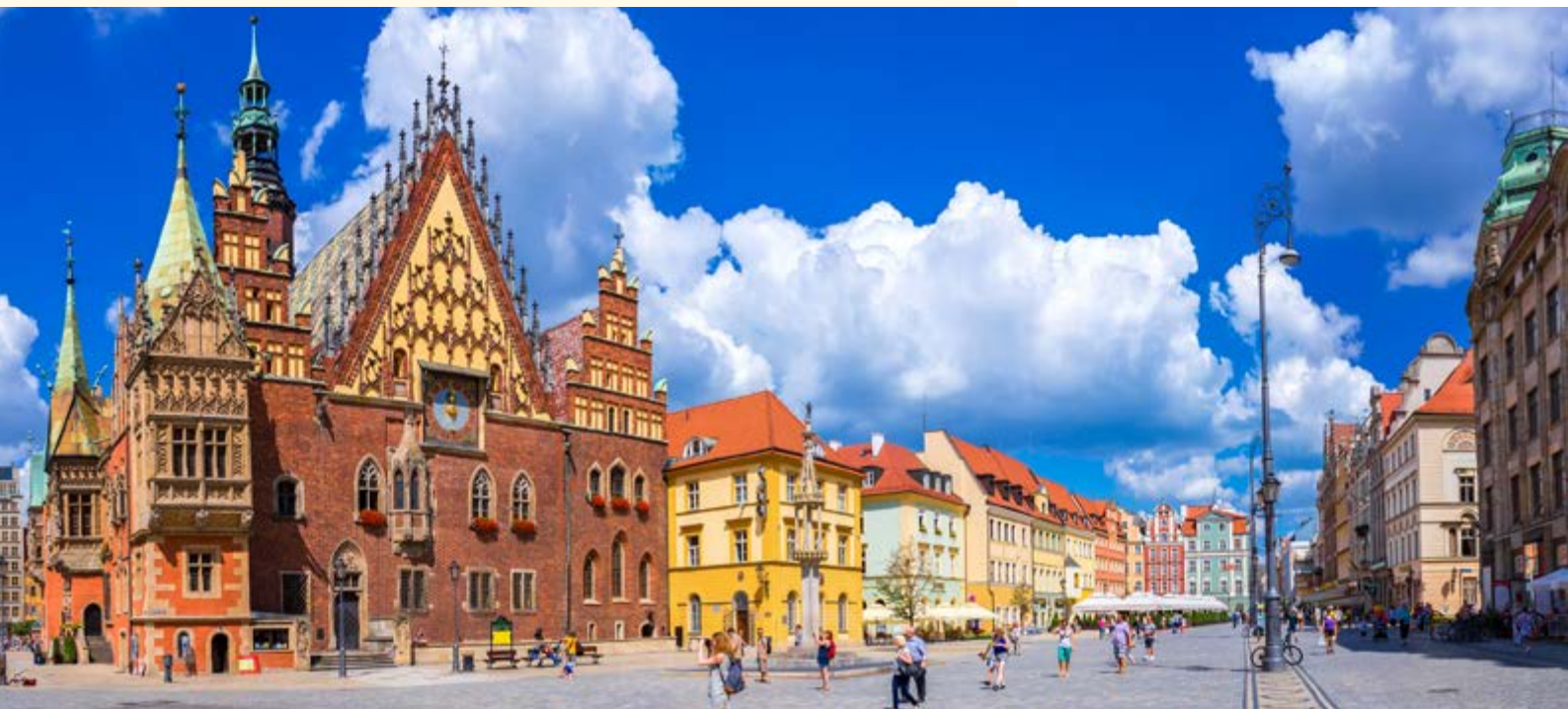
Rathaus in Breslau