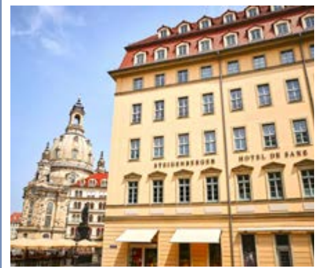
Steigenberger Hotel de Saxe Dresden

Etwa eine Stunde vom Schlosshotel entfernt liegt der Ort Schweidnitz, in dem sich mit der evangelischen Friedenskirche eine der bedeutendsten Sehenswürdigkeiten Schlesiens befindet. Die größte