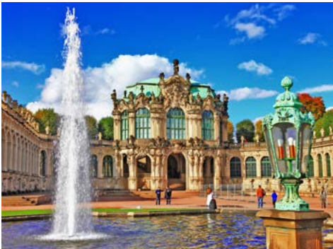
Im Zwinger von Dresden