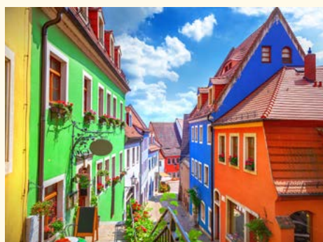
Idylle in Meissen