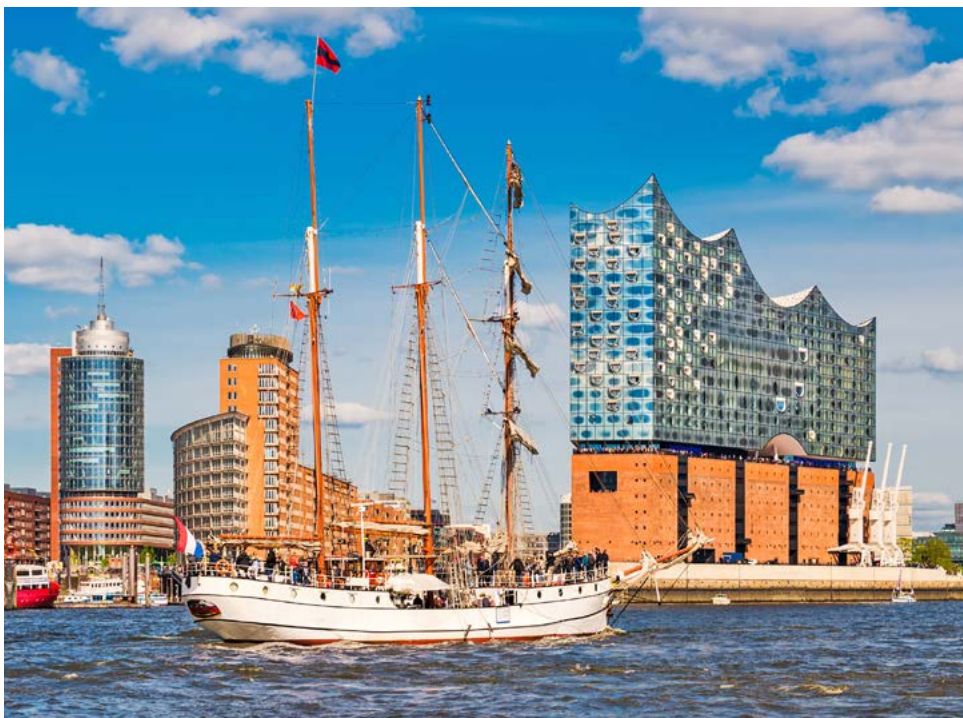
Die Elbphilharmonie in Hamburg