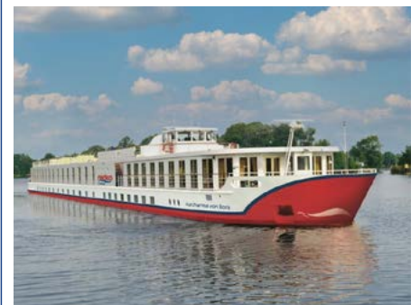
Ihr schwimmendes Hotel