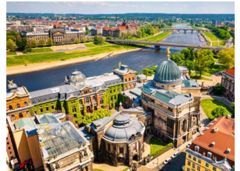
Die Elbe in Dresden

03.04. - 10.04.2021 • ab/an Kiel/Dresden • ab € 1.228,- p.P.