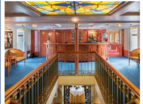
Stilvolles Ambiente an Bord