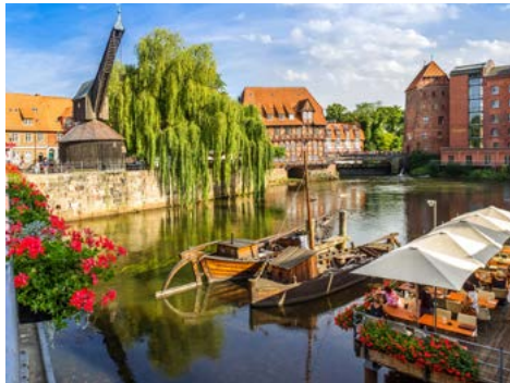
In Lüneburg