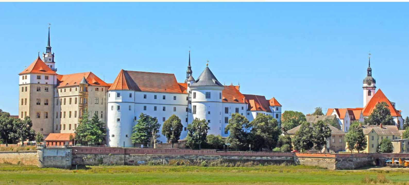
Blick auf Torgau am Ufer der Elbe