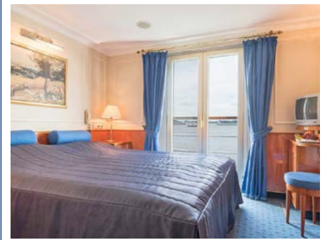
Kabine mit franz. Balkon auf dem Oberdeck

Alle Abfahrts- und Ankunftszeiten sind als Richtzeiten zu betrachten.