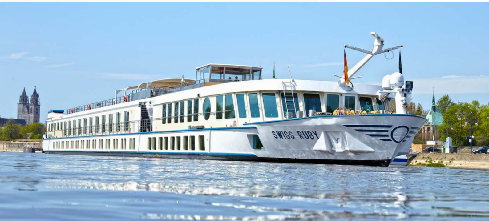
MS Swiss Ruby