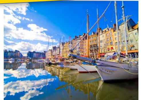
Weißer Pferde in der Camargue

April und August 2019 • ab/an Paris • ab € 1.199,- p.P. in der 2-Bett-Außenkabine