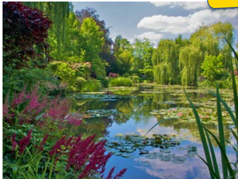
Jardin de Claude Monet, Giverny