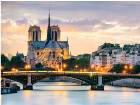
Lichterfahrt in Paris