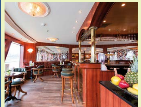
Gepflegte Atmosphäre an Bord