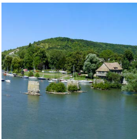
Die alte Mühle bei Vernon

tes Sonnendeck. Die Crew der Swiss Ruby wird Sie während Ihres Aufenthaltes an Bord mit ihrem bekannt guten Service verwöhnen. Genießen Sie die hervorragende Küche mit vier Mahlzeiten täglich. Zum Frühstück erwartet Sie ein Buffet, zum Mittag- und Abendessen hervorragend abgestimmte Menüs direkt am Platz serviert. Bon Appetit!