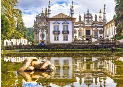
Mateuspalast in Vila Real