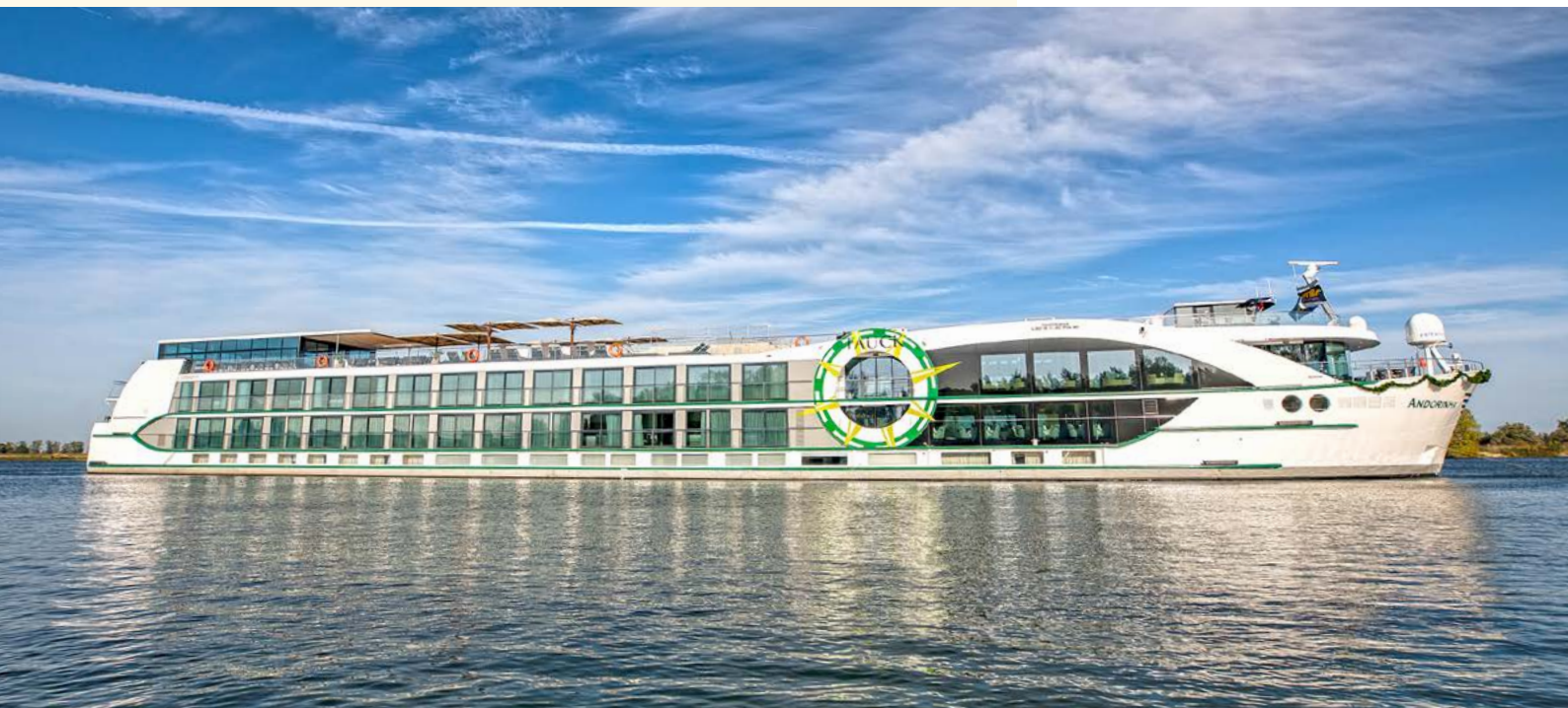
Das brandneue und luxuriöse Fluss-Schiff MS Andorinha