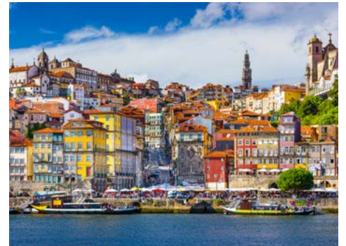
Die Altstadt von Porto