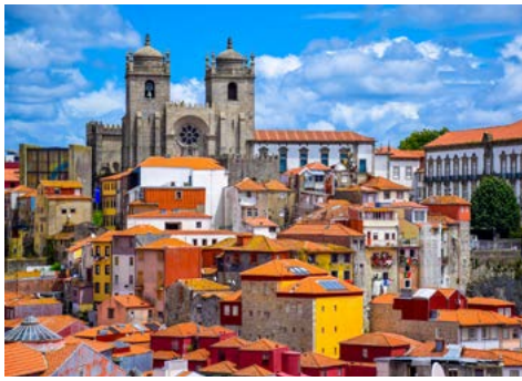
Kathedrale in Porto