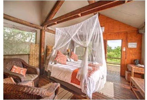
Nkambeni Safari Camp Luxury Tent