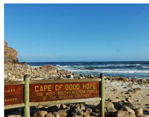
Kap der Guten Hoffnung