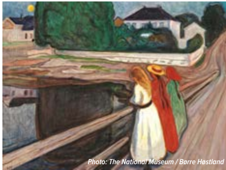
Edvard Munch: Mädchen auf der Brücke