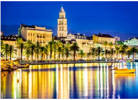
Uferpromenade von Split