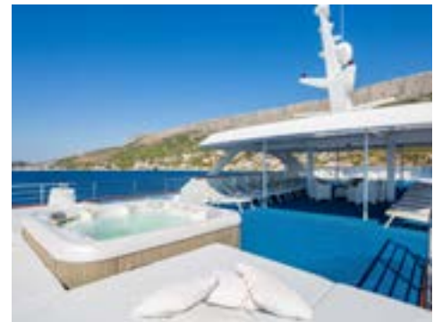
Whirlpool auf dem Sonnendeck