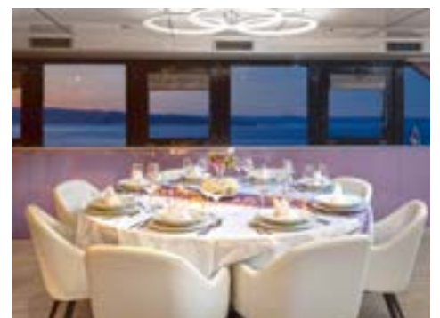
Gepflegte Kulinarik im Bordrestaurant