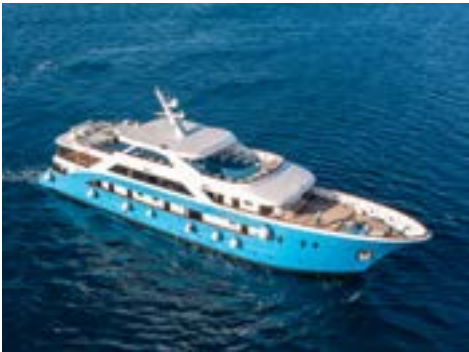
Deluxe Motoryacht San Antonio