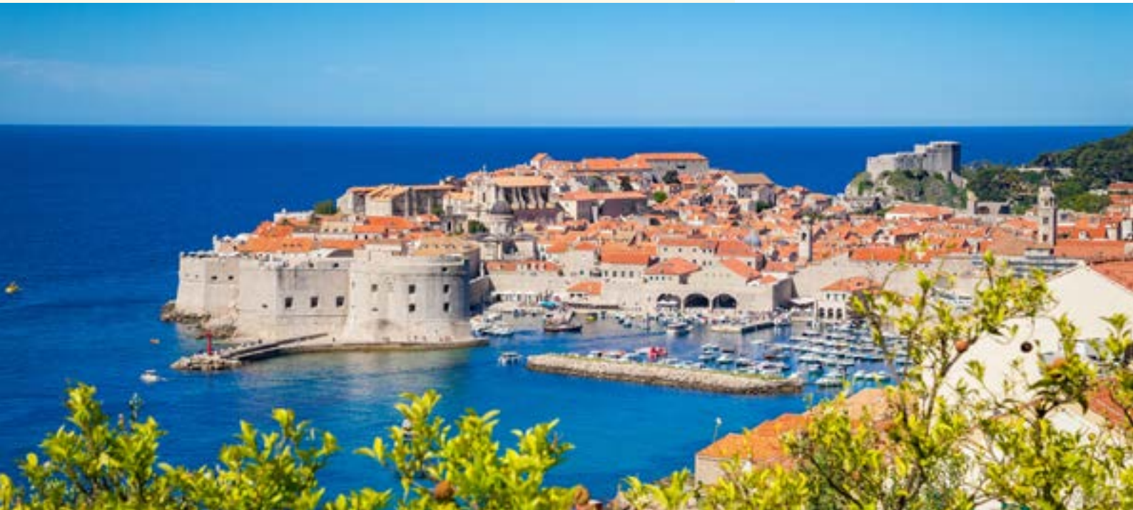
Die Altstadt von Dubrovnik