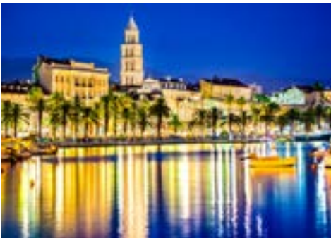
Uferpromenade von Split