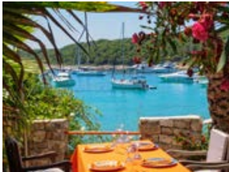
Im Hafen von Hvar