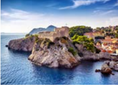
Festung Lovrijenac in Dubrovnik