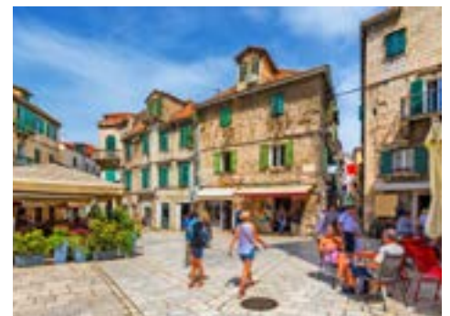
In der Altstadt von Split