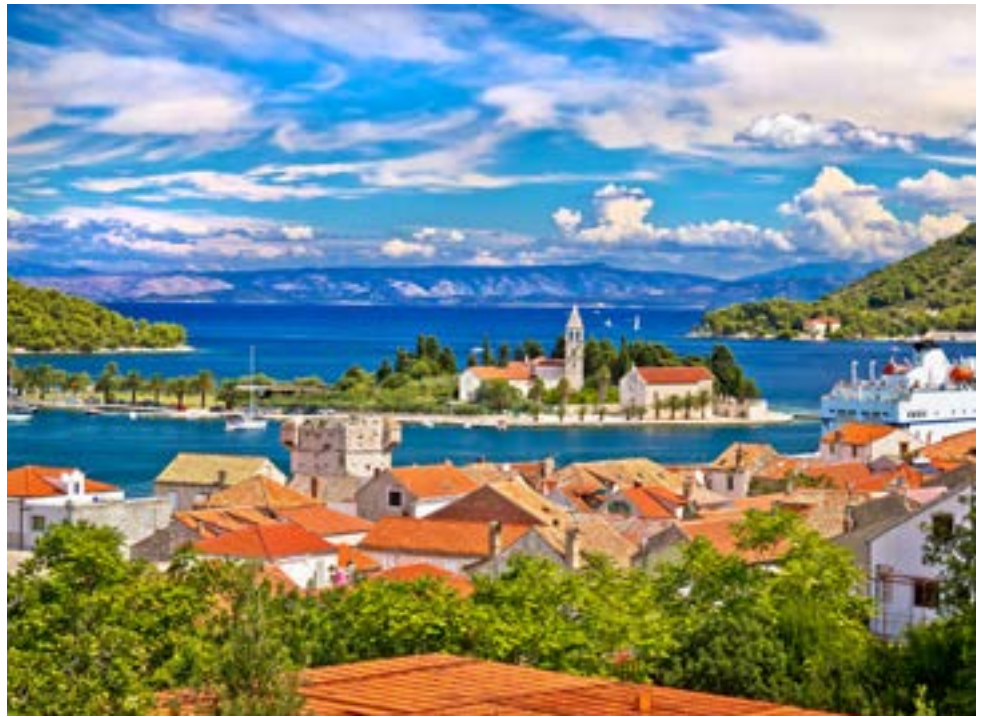
Geheimtipp: die Insel Vis