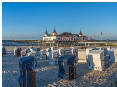
Seebücke auf Usedom

Am Morgen erfolgt die kurze Überfahrt nach Lauterbach auf Rügen. Dort angekommen unternehmen wir eine ausführliche Rundfahrt und werden viele Motive des Malers sehen. Höhepunkt unseres Besuchs auf der Insel ist ein Spaziergang über den