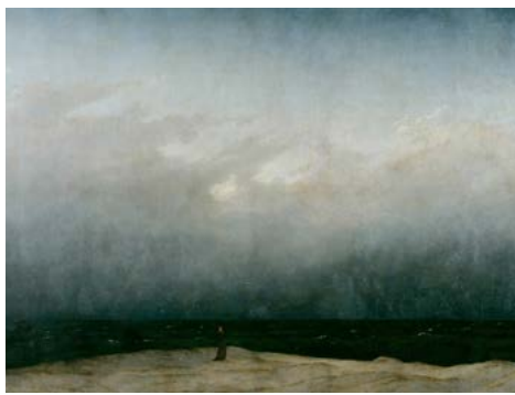
Caspar David Friedrich - Der Mönch am Meer

ten sowie die Darstellung der Natur eine intensive emotionale Wirkung erzielen. Die Themen seiner Gemälde waren oft geprägt von Einsamkeit, Melancholie und Naturverbundenheit. Er war fasziniert von der unendlichen Weite und Erhabenheit der Natur und brachte dies in seinen Werken zum Ausdruck. Friedrich malte oft menschenleere Landschaften, in denen der Betrachter eine Art Verbindung mit der Natur spüren konnte. Seine Bilder strahlen häufig eine gewisse Stille und Erhabenheit aus, die den Betrachter in eine kontemplative Stimmung versetzen. Ein charakteristisches Merkmal seiner Werke war auch die häufige Darstellung von Ruinen, verfallenen Gebäuden und Friedhöfen, die symbolisch für Vergänglichkeit und Transzendenz standen. Diese Motive drückten oft auch seine tiefe Religiosität und seine Auseinandersetzung mit metaphysischen Fragen aus.