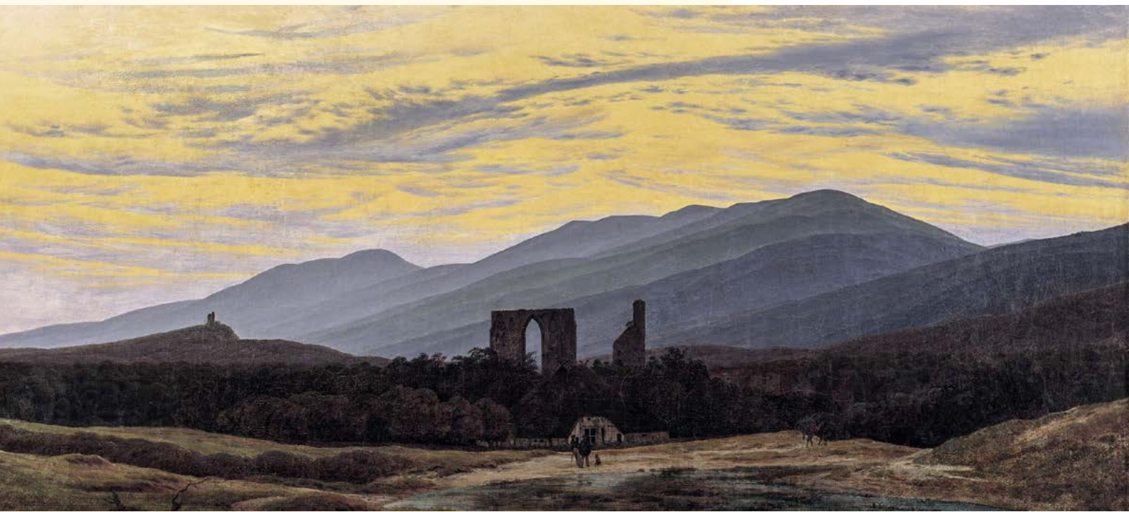
Caspar David Friedrich: Ruine Eldena im Riesengebirge