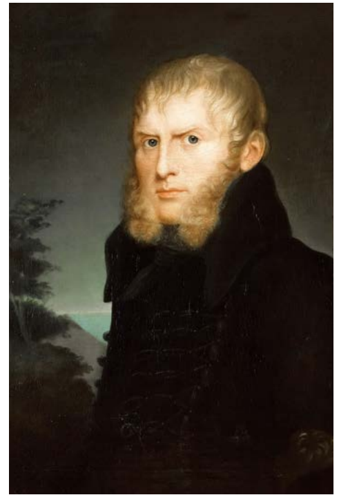
Caspar David Friedrich