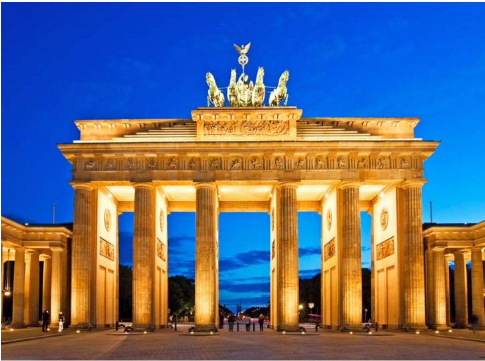
Abendliches Brandenburger Tor