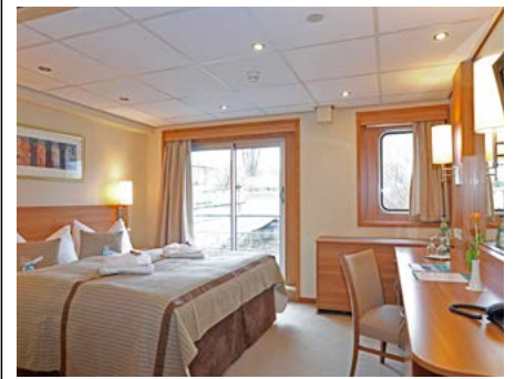
Suite auf dem Diamant-Deck

Caspar David Friedrich. Lebenslinien: Das Pommersche Landesmuseum verfügt mit sechs Gemälden, mehr als 60 Zeichnungen und Druckgrafiken sowie zahlreichen Archivalien und Briefen über eine der umfangreichsten Sammlungen an Originalmaterialien aus Caspar David Friedrichs Leben und Werk weltweit. Die Sonderausstellung »Lebenslinien« präsentiert die umfangreichen Bestände des Museums erstmals nahezu geschlossen und bringt sie in einen Dialog mit Kostbarkeiten wie dem Taufeintrag von 1774 und zusätzlich geliehenen Arbeiten als besonderen »Geburtstagsgästen«, um so den Weg Friedrichs von den ersten zeichnerischen Gehversuchen bis zum malerischen Spätwerk nachzuzeichnen. Schirmfrau der Sonderausstellung ist Staatsministerin für Kultur und Medien Claudia Roth.