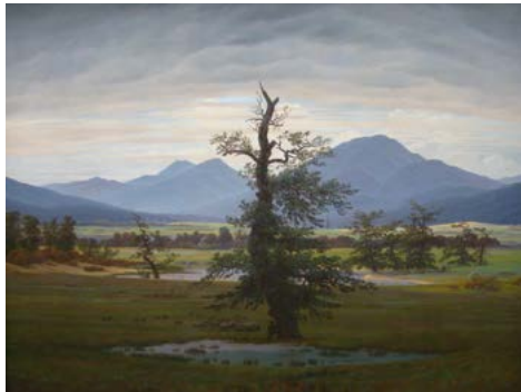
Caspar David Friedrich: Dorflandschaft