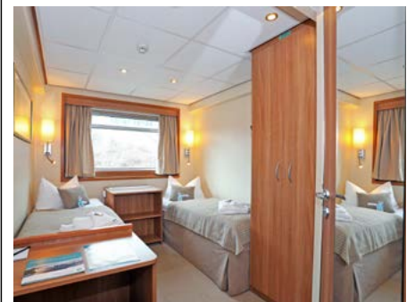
Alle Kabinen sind Außenkabinen