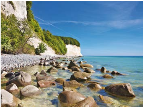
Kreidefelsen auf Rügen