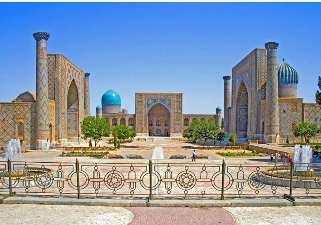
Registanplatz in Samarkand

Reiseverlauf: Urgentsch - Chiwa - Buchara - Samarkand - Taschkent