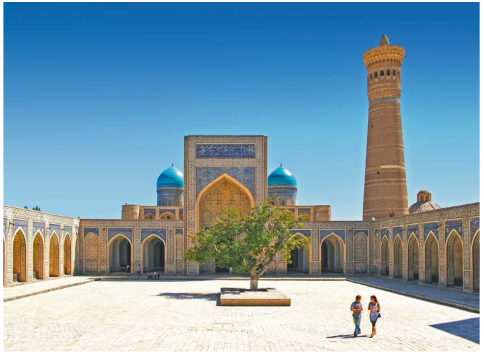
Im Poi-Kalon Komplex in Bukhara

Die Handelsstadt an der Seidenstraße hat noch viel mehr zu bieten! Mitten im Zentrum lockt das prächtige Gebäudeensemble Poi Kalon. Mit 46 Metern Höhe ist das Kalon-Minarett als Wahrzeichen der Stadt weithin zu sehen, auch die Kalon-Moschee und zwei Koranschulen gehören zum berühmten Komplex. Vorbei an der sehenswerten Ulugbek-Madrasa führt der Stadtspaziergang durch das historische Zentrum von Buchara zu den drei traditionellen, überkuppelten Basarbauten aus dem 16. Jahrhundert Toqi Sarrofon,