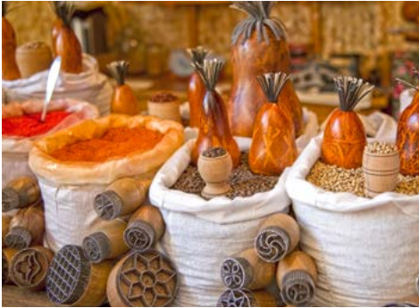
Gewürze auf dem Markt

Machmud Komplexes auf dem Programm. Zum Abschluss geht es weiter zum Tach-Hauli-Palast mit seiner eleganten Architektur. Am Abend Galadinner in der Sommerresidenz Tosa Bog mit choresmischer Folklore.