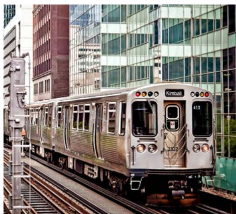
Chicago Elevated, die Hochbahn der Stadt

Am Vormittag landen Sie mit unzähligen Eindrücken wieder in Zürich.