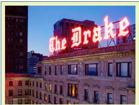
The Drake, A Hilton Hotel