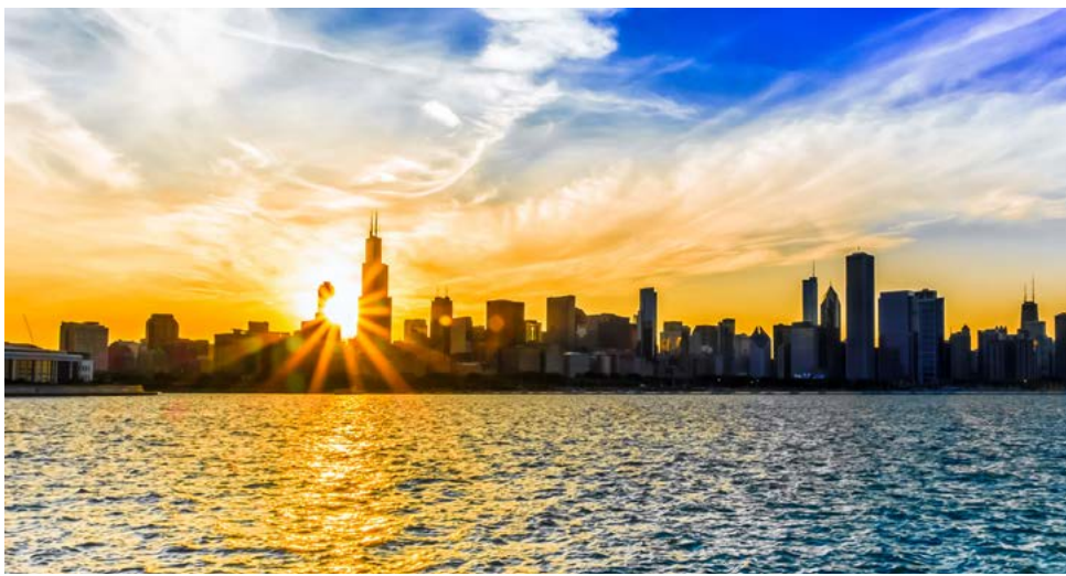
Sonnenuntergang über Chicago