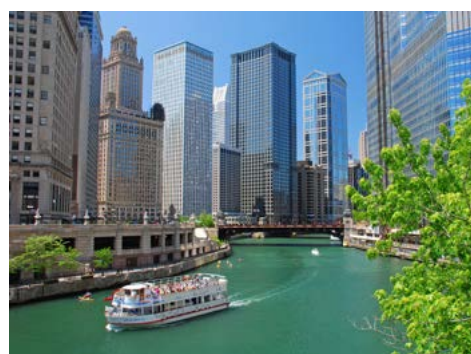
Bootstour auf dem Chicago River

Den heutigen Tag in Chicago können Sie ganz nach Ihren Wünschen und individuell gestalten. Ihre Reiseleitung hat genügend Tipps und Informationen für eine individuelle Tagesgestaltung. Eines der zahlreichen Museen, ein Bummel über die Einkaufsstraßen der Innen-