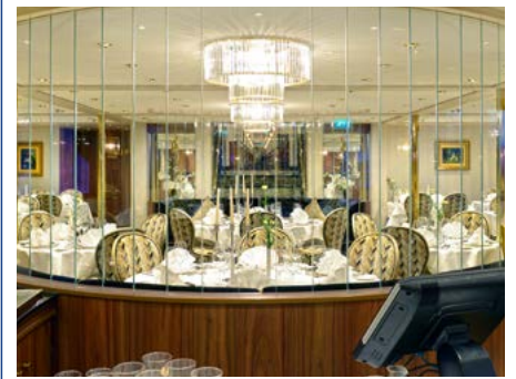
Elegante Gastlichkeit an Bord

Alle Abfahrts- und Ankunftszeiten sind als Richtzeiten zu betrachten.