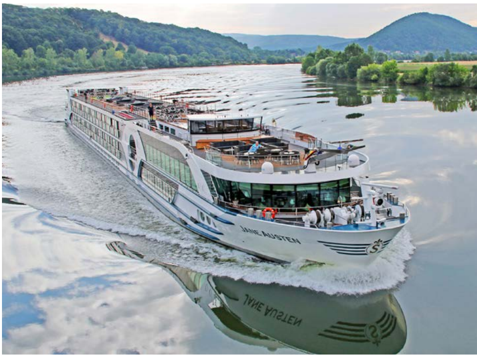
Das First-Class-Schiff MS Jane Austen

terung entspannt auf dem Sonnendeck oder in der Panorama-Loungebar genießen. Die Seine verbreitert ihr Flussbett dabei immer mehr und spätestens in Le Havre wird die Hochseeschiffahrt unser ständiger Begleiter.