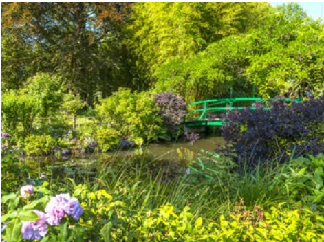
In den Monet-Gärten