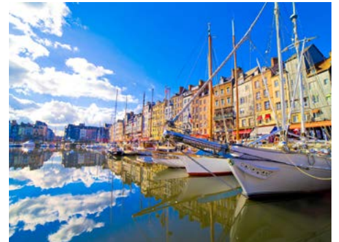
Alter Hafen von Honfleur