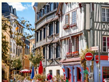
Altstadt von Rouen