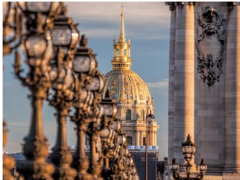
Invalidendom in Paris