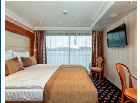
Kabine mit französischem Balkon