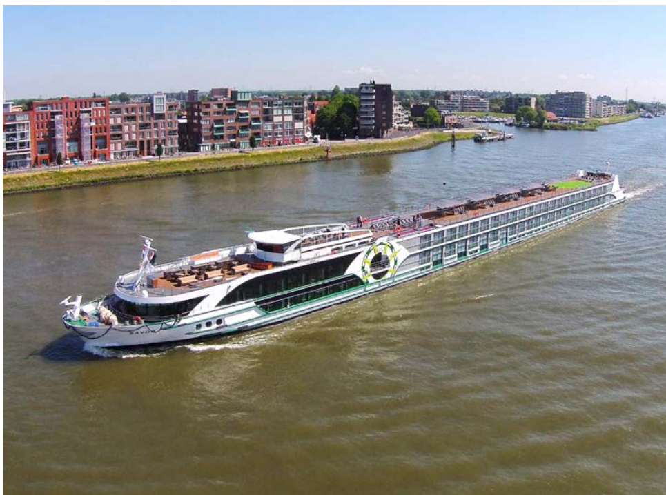
Flusskreuzer der Luxusklasse: MS Savor

Deck oder in der gemütlichen Loungebar. Ankunft in Wien um 20 Uhr.