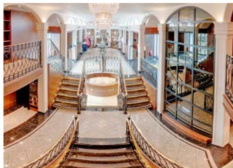
Gepflegte Eleganz an Bord