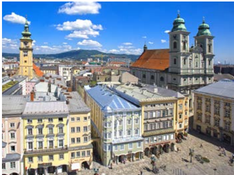
Linz, Kulturhauptstadt in 2009