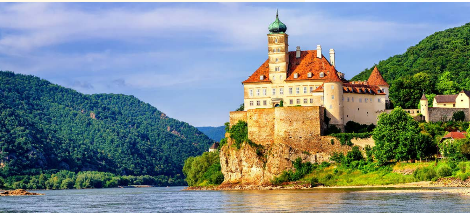
Schönbühel in der Wachau