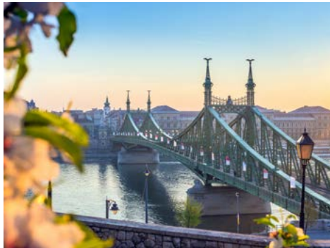
Die Friedensbrücke in Budapest