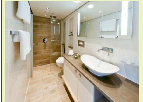
Beispiel für ein Suite-Badezimmer